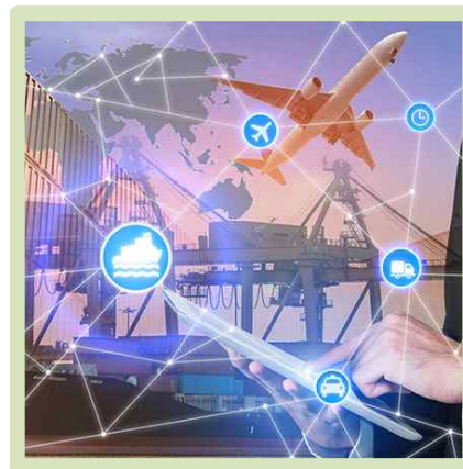
글로벌 기업 2,000 개 유치