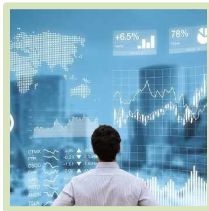
무역, 물류, 금융 비즈니스 기능 강화