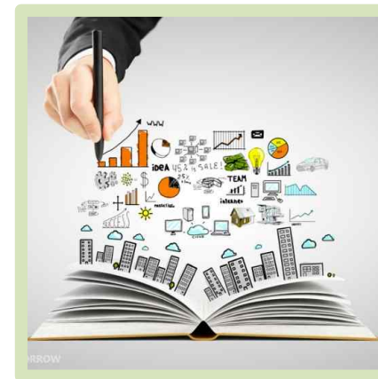
무역, 물류, 금융 비즈니스맨 70 만명 육성