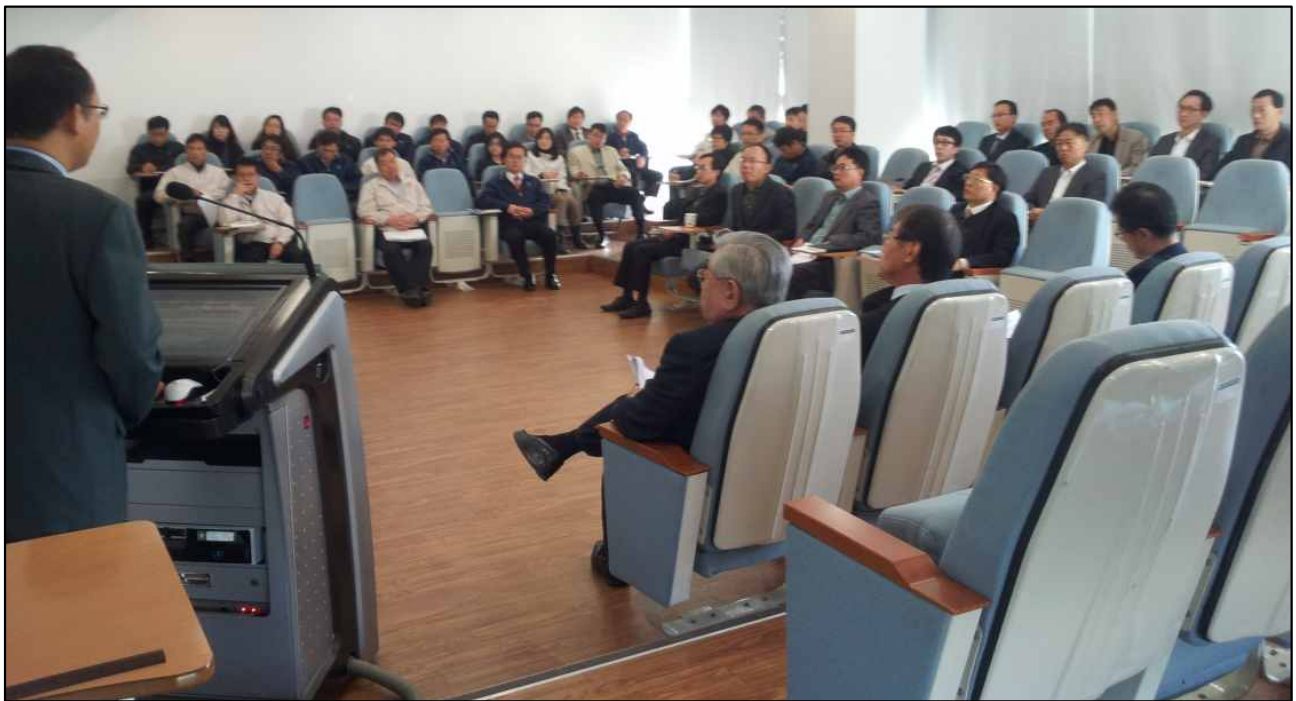
〈대학평가 2차 워크숍 개최(2011.11.15.)〉