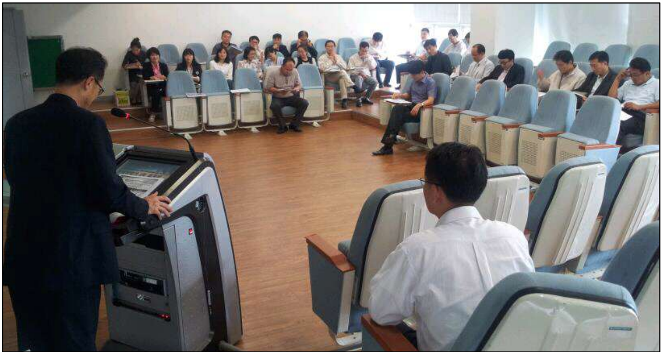
〈대학평가 1차 워크숍 개최(2011.09.20.)〉