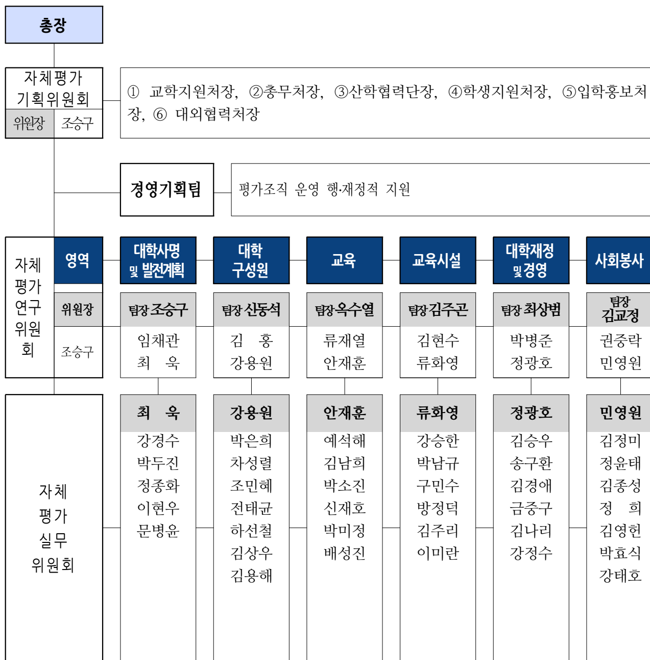
〈자체평가 추진 조직도〉