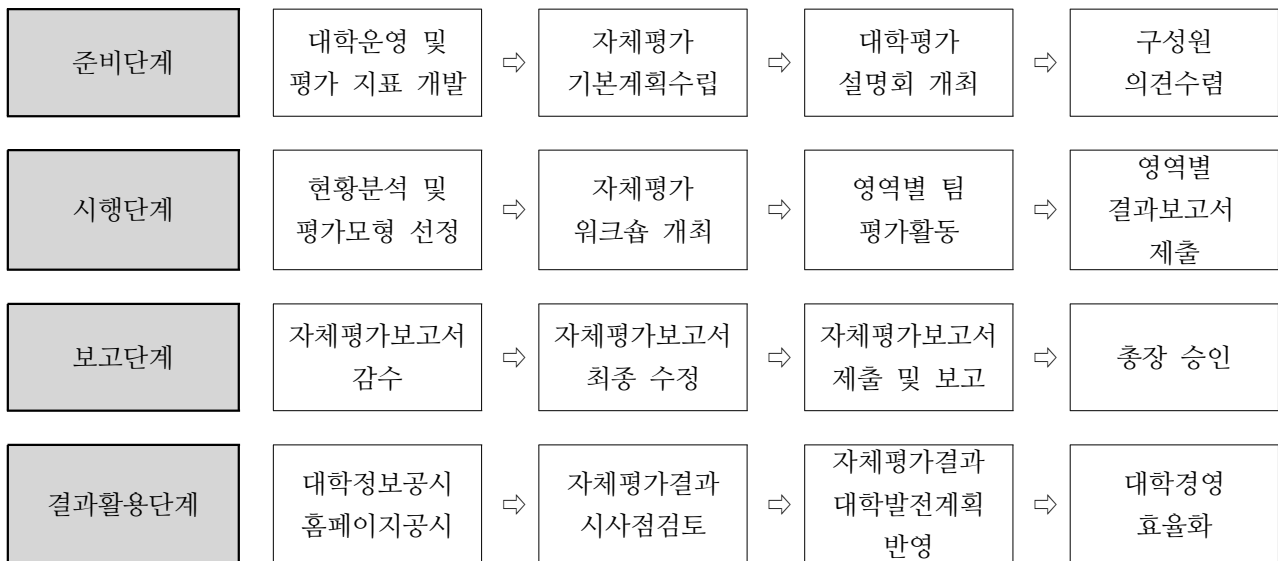
〈자체평가 추진 절차〉

2011년 대학자체평가는 크게 준비단계, 시행단계, 보고단계, 결과활용단계로 구분되어 시행되었다. 준비단계에서는 우선 2009년에 시행된 대학자체평가 시행과정을 종합적으로 검토하고 우리 대학의 현황 및 평가 방향 등이 검토되었으며, 2011년 대학자체평가 기본계획을 수립하고 구성원의 의견을 수렴하였다. 시행단계는 2011년 대학자체평가모형을 대학기관평가인증제형으로 채택하였고, 자체평가워크숍을 개최하여 평가과정을 논의하였다. 이후 각 영역별 팀에서 분석활동과 평가활동이 진행되었으며 이에 대한 결과보고서를 제출하였다. 영역별 제출된 결과보고서는 감수와 최종수정단계를 거쳐 최종결과보고서로 작성되어져 총장에게 보고된 후 대학알리미 및 대학홈페이지에 공시되었다. 금번 대학자체평가보고서는 향후 자기평가결과 시사점 검토, 자체평가 결과 대학발전계획 반영 등 대학 운영에 있어 실질적인 자료로 활용될 예정이다.