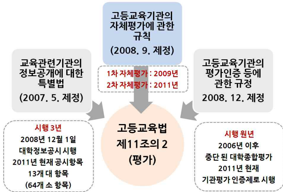
〈자체평가 관련 법령〉